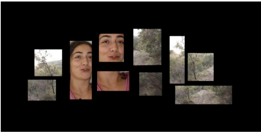
Pasos (Frontières) (2009) / Olivier Moulai (France)

« Honorer la mémoire des anonymes est une tâche plus ardue qu'honorer celles des gens célèbres. L'idée de construction historique se consacre à cette mémoire des anonymes. » Une installation sur les traces du chemin de Walter Benjamin en offrant la parole à d'autres récits d'exil.