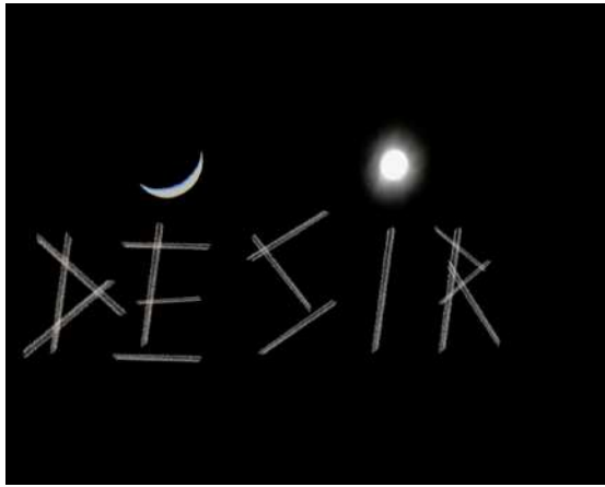
Désir (2016) / Richard Skryzak (France)

Le Désir peut-il encore s'exprimer de nos jours comme pur Désir ? Il est pour moi le maître-mot de la création artistique, comme de la vie tout court. C'est pour cela que je l'ai inscrit dans un ciel de nuit à l'aide de traces d'avions combinées à la lune. Pour qu'il continue de nous éclairer de ses multiples résonances. Avant de s'effacer comme ces traces de craies sur le tableau noir. Je crois sincèrement que le Désir est en danger. Et que la création est un des moyens qui s'offrent à nous de le sauver.