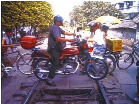
La traversée du rail (2014) / Robert Cahen (France)

Le Désir peut-il encore s'exprimer de nos jours comme pur Désir ? Il est pour moi le maître-mot de la création artistique, comme de la vie tout court. C'est pour cela que je l'ai inscrit dans un ciel de nuit à l'aide de traces d'avions combinées à la lune. Pour qu'il continue de nous éclairer de ses multiples résonances. Avant de s'effacer comme ces traces de craies sur le tableau noir. Je crois sincèrement que le Désir est en danger. Et que la création est un des moyens qui s'offrent à nous de le sauver.