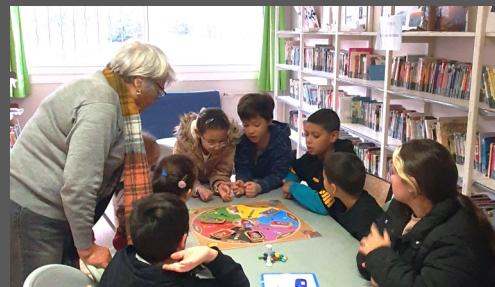
Des élèves de CM découvrent le jeu Laïque'Cité

Depuis de nombreuses années des Délégués Départementaux de l'Éducation Nationale (DDEN) d'Aix en Provence de Saint Martin de Crau, de Châteaurenard, de Marseille... accompagnent les initiatives pédagogiques d'enseignants pour explorer le thème de la laïcité, notamment dans le cadre de la journée nationale de la laïcité.