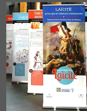
L'exposition du Livre Géant de laïcité du CD13 installée en Mairie des Pennes-Mirabeau

Les DDEN qui veillent à ce que ce principe, au fondement du Service public de l'Éducation, reste un principe de liberté et de respect d'autrui, encouragent et facilitent ces démarches. Nous vous présentons ci-après des outils utilisés dans des écoles du premier degré.