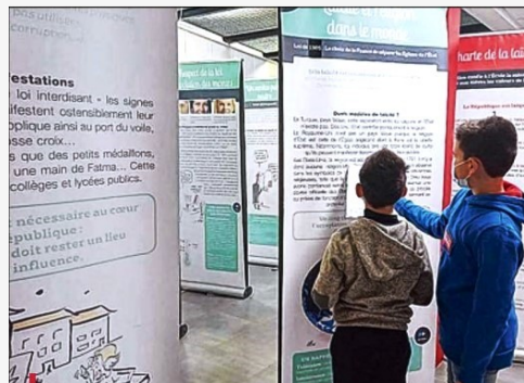
CM2 de Saint Martin de Crau

Depuis la rentrée 2023, les expositions du Livre Géant de la Laïcité circulent, dans le département des Bouches-du-Rhône. Des collectivités comme le Conseil Départemental et des associations comme l'association des Maires, l'OLPA ou la Ligue de l'enseignement en ont fait l'acquisition.